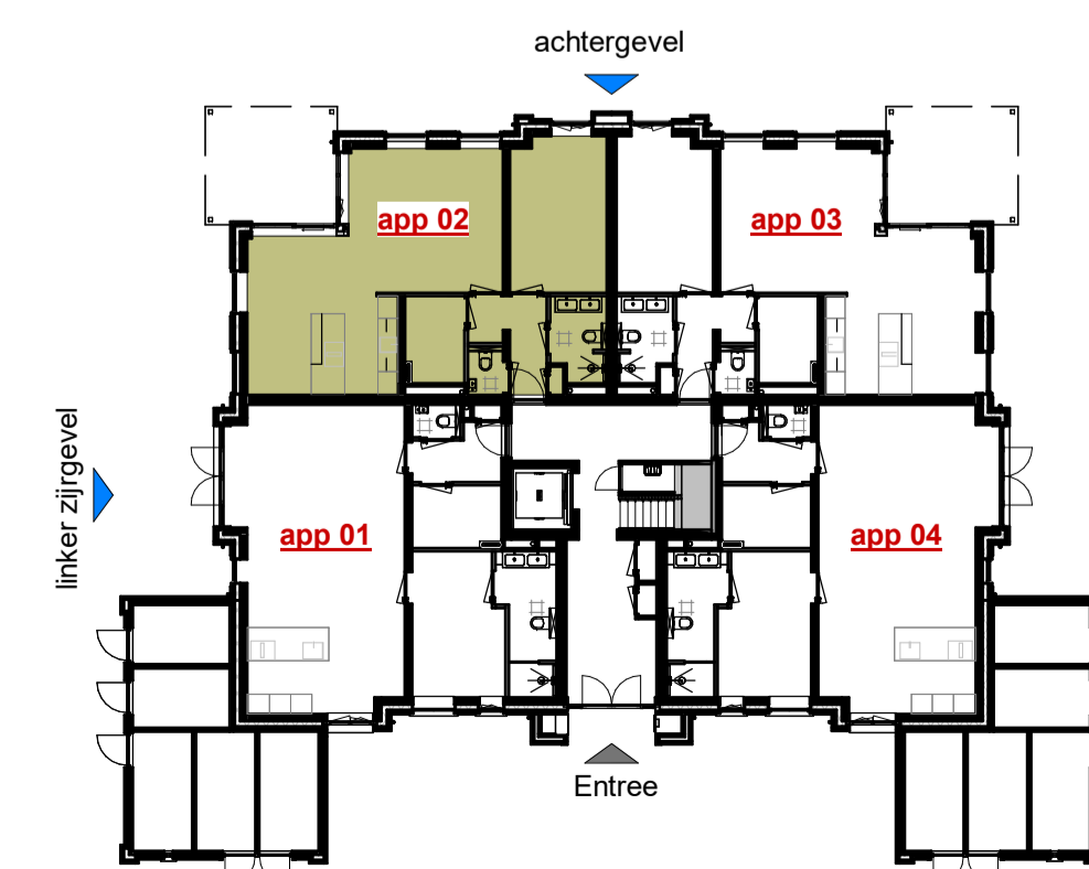
Plaatsaanduiding appartement, gelegen op de begane grond